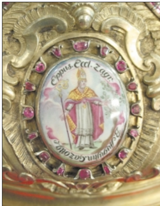
Slika bl. Augustina Kažotića na pokaznici

Crkva u Hrvata proslavila je 2003./2004. u Zagrebu »GODINU BL. AUGUSTINA KAŽOTIĆA« povodom 300. obljetnice njegove beatifikacije. 2003. godine proslavila se 680. obljetnica njegove smrti te 2004. godine 700. obljetnica dolaska na sjedište zagrebačkih biskupa. Razlog je to da se još jednom osvrnemo na tragove štovanja bl. Augustina Kažotića u samoj zagrebačkoj katedrali kao i u Zagrebačkoj (nad)biskupiji.