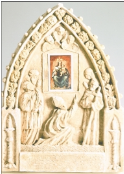
Oltar MB po zamisli Mile Wood U sredini kleči bl. Augustin Kažotić

koja je ostala neoštećena u požaru Vermičeve kurije na Kaptolu. U sredini je prikazan bl. Augustin Kažotić koji klečeći, s mitrom na glavi, pokazuje desnom rukom na sliku Majke Božje. S desna i lijeva su i ostali hrvatski blaženici.