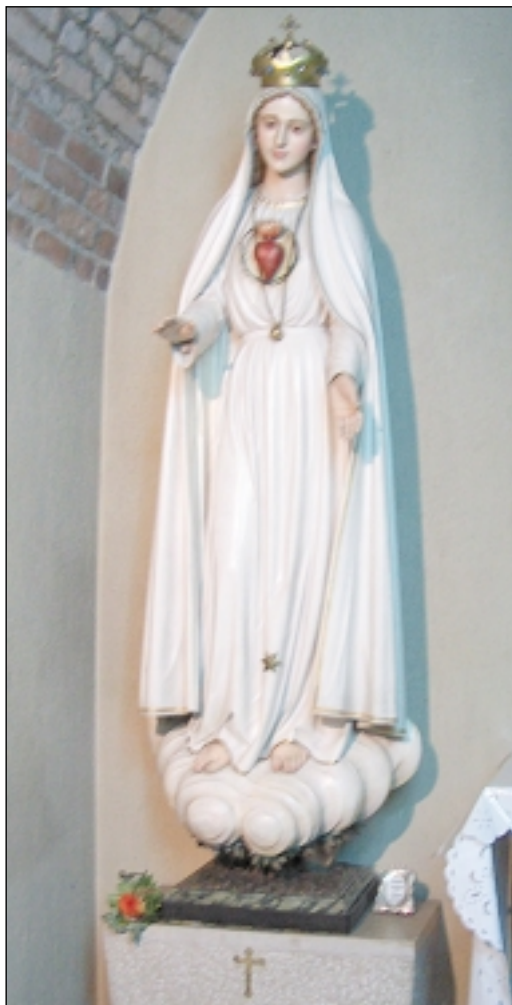
Kip Majke Božje Fatimske u kapelici

U zidu iznad oltara u niši sa srebrenim okvirom nalaze se moći bl. Augustina na srebrenom postolju u srebrenoj škrinjici na nožicama s reljefnim ukrasima u obliku ukrasnog tabletića, veličine 7 x 7 cm, visine 6 cm. S jedne i druge strane škrinjice su električne svjeći-