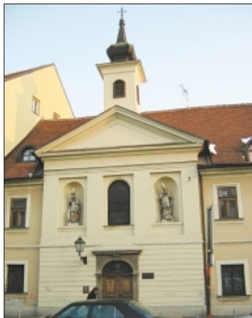
Pročelje crkve sv. Martina u Vlačkoj s kipovima sv. Kvirina i bl. Augustina Kažotića