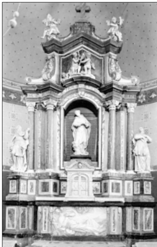
Lupoglav – oltar bl. Augustina Kažotića

1856. godine Ivan Kukuljević Sakcinski opisuje zagrebačku katedralu s umjetničkog gledišta te spominje relikvije na oltaru sv. Jurja koje je pribavio bl. Augustin Kažotić. Na istom oltaru je kasnije uz ostale kipove izrađen i kip bl. Augustina Kažotića. Kukuljević kaže u istom opisu da oltar sv. Jurja i bl. Augustina biskupa zagrebačkog spada među najljepše u stolnoj crkvi, a bio je s lijeve strane od kapele Bezgrešnog Začeca BDM. Kukuljević navodi svjedočanstvo jednog rukopisca prema kojem je oltar izrađen troškom kanonika kustosa Ivana Brašića (+1671.). 1747. godine na vrh oltara bio je postavljen krasni mramorni kip bl. Augustina Kažotića, ispod kojega je bio natpis: B. AVGUSTINVS/ GA-ZOTTVS/ EPISVS ZAGRAIS.