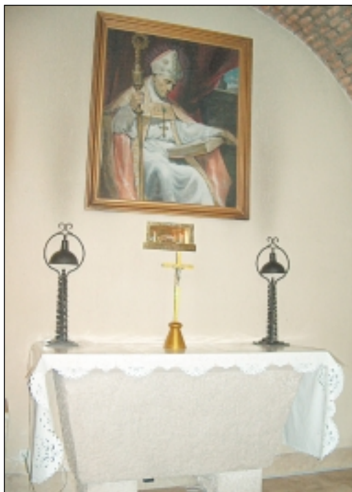
Oltar sa slikom bl. Augustina u kapelici

som. To su bili prijedlozi i ideje koje su ostale neostvarene.