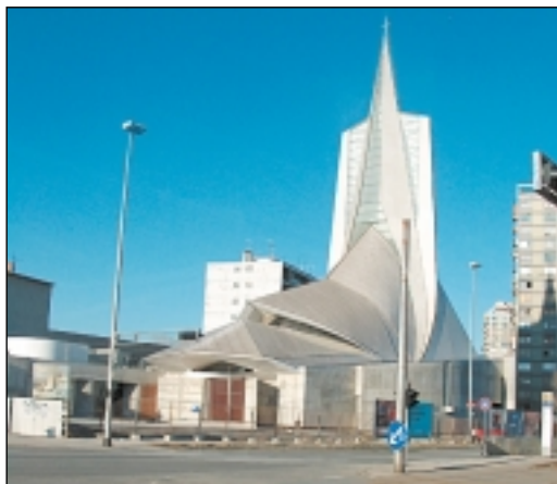
Nova crkva bl. Augustina Kažotića na Peščenici u Zagrebu