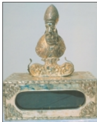
Dragocjeni relikvijar s moćima bl. Augustina Kažotića

Prema njegovoj zamisli 1953. godine kiparica Mila Wood (Vodse-dalek) Bernfest je izradila sadreni model. Model, veličine 43 x 32 cm, prikazuje gotički oblik oltara u čijem bi središtu bila čudotvorna slika Majke Božje