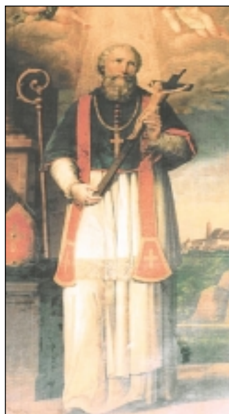
Bergerova slika bl. Augustina u sakristiji katedrale

Okvir je ukrašen lovorovim lišćem i palminom granom u čijem središtu se nalazi na ovalnoj pozlaćenoj ploči Blaženikov mono-