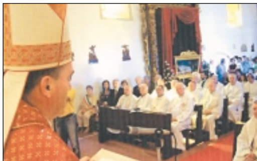
Kardinal Bozanić sa svećenicima u Luceri

de pod vodstvom upravitelja župe Kraljice sv. Krunice oca dominikanca prema projektu arhitekta Borisa Magaša.