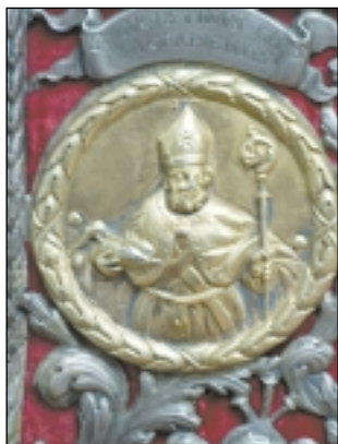
Lik bl. Augustina na omotu svećanog misala

Oltar je bio smješten u zidu s prigradjenom kapelicom. U cijenu od 2000 forinti bio je uračunat i prijevoz po Savi do Kraljeva Broda, odakle su se kanonici obvezali dopremiti ga u katedralu. Tkalčić je podrobno opisao tijek radnje oltara. Nenadana smrt kanonika Đure Dumbovića 1743. godine,