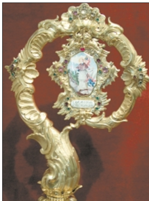
Slika bl. Augustina na biskupskom štapu

Biskup Martin Borković (1667.-1687.) postavlja kameni kip bl. Augustina Kažotića na pročelje obnovljene crkvice sv. Martina u Vlaškoj ulici zajedno sa sv. Kvirinom.