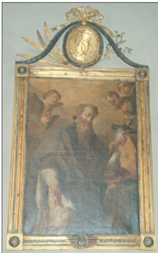
Slika izrađena u Napulju