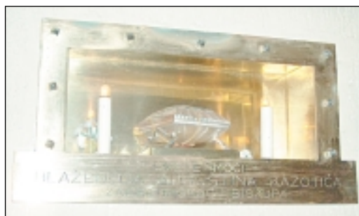
Moći bl. Augustina u kapelici

Kapelica bl. Augustina Kažotića u prizemlju sjevernog tornja zagrebačke katedrale ima površinu 3,90 x 3,80 m. U njezinu unutrašnjost ulazi se iz sjeverne lađe katedrale kroz hodnik dužine 3,15 m i širine 1,03 m, najveće visine 2,33 m. Na ulazu se nalaze nova drvena vrata, 205 x 74 cm, izrađena 1991. godine. Nad ulaznim vratima uklesan je natpis: KAPELA / BL. AUGUSTINA KAŽOTIĆA / ZAGREBAČKOGA BISKUPA / 1303.-1322. Lijevo od ulaza postavljena je ploča s imenima hrvatskih svetaca i blaženika.