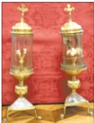
Cilindrični relikvijari koje je nabavio bl. Augustin