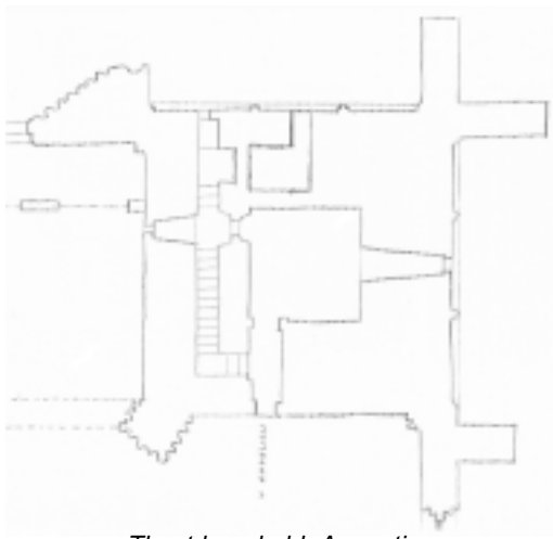
Tlocrt kapele bl. Augustina