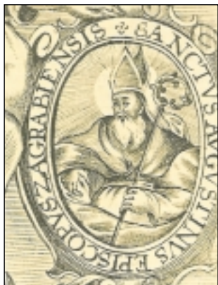
Crtež bl. Augustina s natpisom »sveti«

Na desnoj strani od bl. Augustina Kažotića nalazi se lik sv. Nikole biskupa, u biskupskom ornatu sa štapom u desnoj ruci. U lijevoj